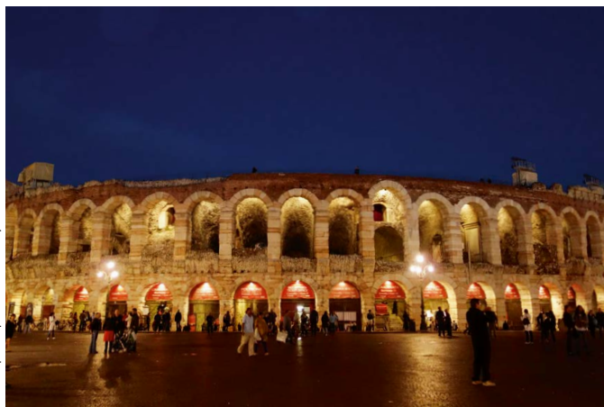
Am Samstag-Abend Besuch der Oper «Nabucco» von Giuseppe Verdi in der Arena von Verona.

Druckfehler und kurzfristige Änderungen vorbehalten.