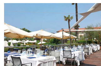
Das 4-Sterne Hotel Caesius Therme & Spa mit großzügigem Wellnessbereich liegt im malerischen Ort Bardolino am Gardasee.