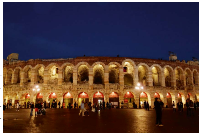
Am Samstag-Abend Besuch der Oper «Nabucco» von Giuseppe Verdi in der Arena von Verona.

Druckfehler und kurzfristige Änderungen vorbehalten.